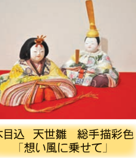
木目込 天世雛 総手描彩色 「想い風に乗せて」

休 時 5月5日(木・祝)まで無 営業時間 午前10時~午後6 崎駅徒歩15分 徒歩1分。JR川崎駅、京急川 崎駅徒歩あり。「貝塚」バス停