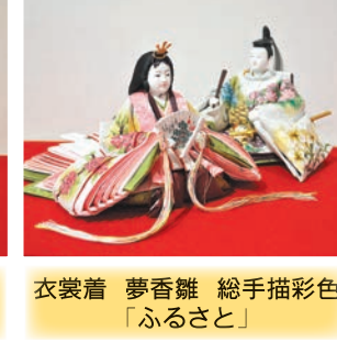
衣裳着 夢香雛 総手描彩色 「ふるさと」