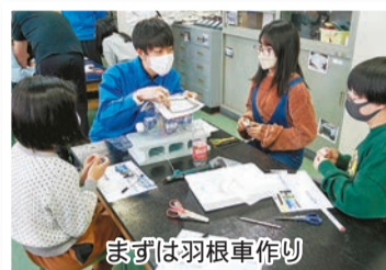
まずは羽根車作り