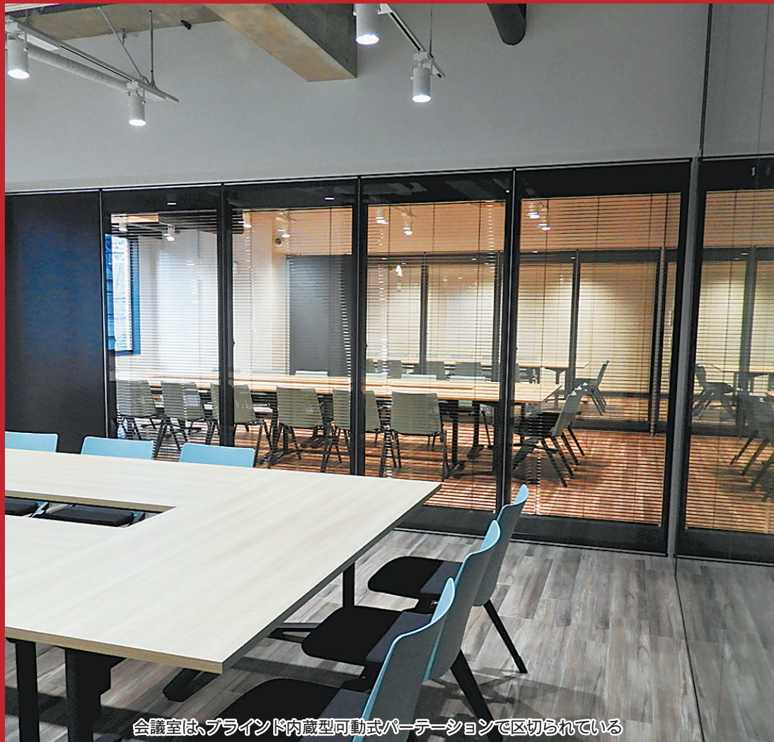
会議室は、ブラインド内蔵型可動式パーテーションで区切られている