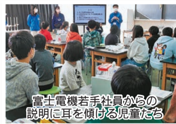
富士電機若手社員からの説明に耳を傾ける児童たち

川崎市立大島小学校(川崎区)で1月13日、富士電機川崎工場(同区)の若手社員らが講師を務める理科教室があり、子どもたちは、実験で発電の仕組みを考えながら身近な電気エネルギーについて学びました。教室は市との共催。