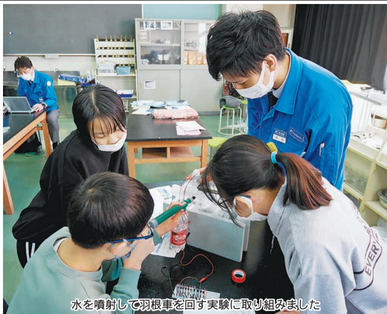
水を噴射して羽根車を回す実験に取り組みました

川崎市立大島小学校(川崎区)で1月13日、富士電機川崎工場(同区)の若手社員らが講師を務める理科教室があり、子どもたちは、実験で発電の仕組みを考えながら身近な電気エネルギーについて学びました。教室は市との共催。