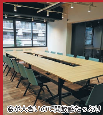
窓が大きいので開放感たっぷり