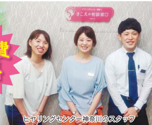
ヒヤリングセンター神奈川のスタッフ