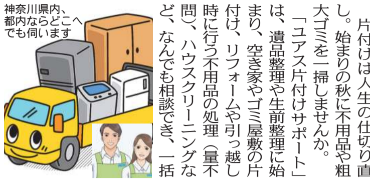
神奈川県内、都内ならどこへでも伺います

片付けは人生の仕切り直し。始まりの秋に不用品や粗大ゴミを一掃しませんか。 「ユアス片付けサポート」は、遺品整理や生前整理に始まり、空き家やゴミ屋敷の片付け、リフォームや引っ越し時に行う不用品の処理(量不問)、ハウスクリーニングなど、なんでも相談でき、一括