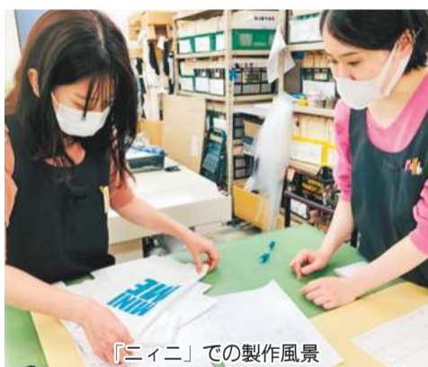
「ニイニ」での製作風景

の再利用でした。 愛着のある洋服や残しておきたい子ども服などをリメイクでよみがえらせて、ずっと使い続けてもらえたら。そこで「捨てないアパレル」を企業理念に掲げ、持ち込まれた着物や毛皮などを使い、新しい衣料品に生まれ変わらせる「グレードアップリメイク」を手掛ける「ニイニ」(埼玉県蕨市)に相談。世界で一つだけの「リメイクエコバッグ」が誕生しました。