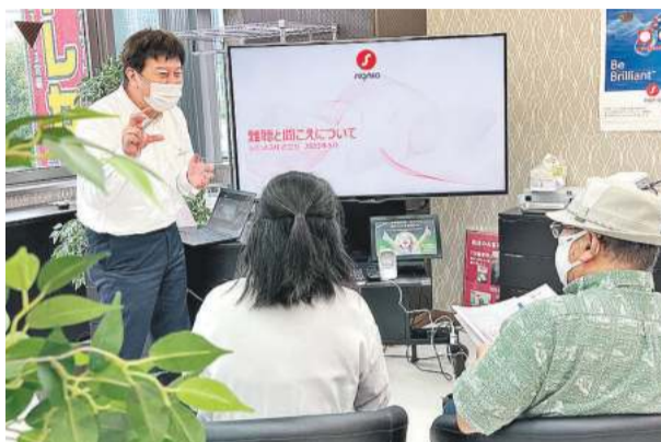
以前川崎本店で行われた同社主催の補聴器セミナーの様子

店舗はJR川崎駅東口の本店のほか、横浜市西区の横浜新都ビル(そごう)9階に「横浜プレミアム