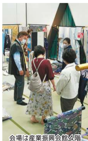
会場は産業振興会館4階

和楽庵では、9月16日(金)と17日(土)に川崎市産業振興会館4階展示場でリサイクルきもの大市を開催します。16日午前10時~午後7時、17日午前10時~午後6時。 リサイクル着物・帯は全品20%オフ。上物のリサイクルリサが20点限り1万1000円に。「着物クリーニング」も安価で受け付けます。