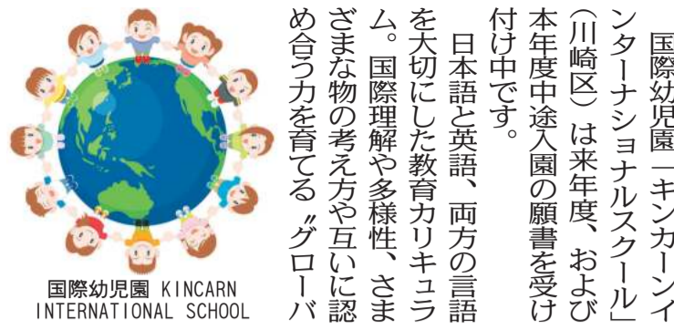
国際幼稚園 KINCARN INTERNATIONAL SCHOOL

国際幼稚園「キンカーンインターナショナルスクール」は来年度、および本年度中途入園の願書を受け付け中です。 日本語と英語、両方の言語を大切にされた教育カリキュラム。国際理解や多様性、さまざまな物の考え方や互いに認め合う力を育てる「グローバル