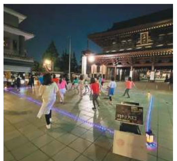
暗くなると幻想的な雰囲気

主催は、大師地区周辺の町おこしに取り組む団体「大師ONE博(わんぱく)」。参加者たちは、ワイヤレスのイヤホンで音楽を共有し、周りに騒音を出さない「サイレントディスコ」形式で、ラテン系の音楽とダンスを組み合わせて