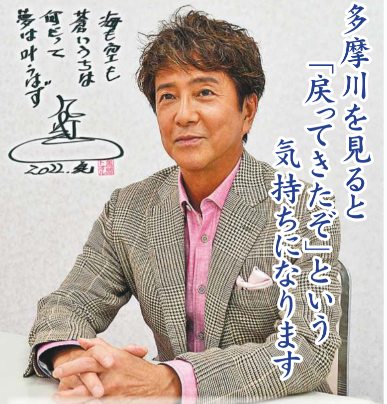
俳優 風間トオルさん

1962年、中原区出身。数々の雑誌モデルを経て、1989年にテレビドラマ「ハートに火をつけて」で俳優デビュー。「科捜研の女」シリーズでは宇佐見裕也役。バラエティー番組でも活躍中。