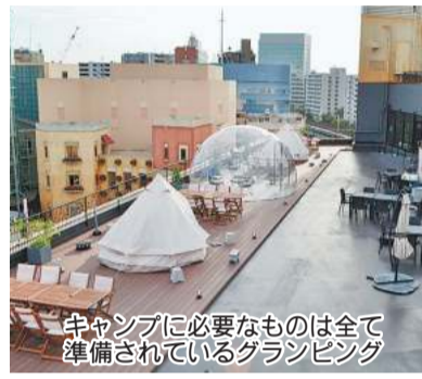
キャンプに必要なものは全て準備されているグランピング

川崎駅東口で、グランピング体験を! 複合商業施設「ラ チッタテッラ」屋上に8月にオープンした野外レストラン「CIELO GRANDE(シエロ グランデ)」&黄金のキッチン」では、都市型グランピングとBBQが楽しめます。