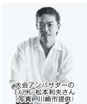
大会アンバサダーのEXILE 松本利夫さん

10月22日(土)午前11時から午後7時(予定)まで、川崎ルフロロン1階イベントスペースで、ダンスコンテスト「ルフロロン杯」が行われます。 1990年代に毎年開かれ、多くのトップダンサーを輩出した「ルフロロン杯」ですが、2000年の第10回で閉幕しました。今回「聖地」と