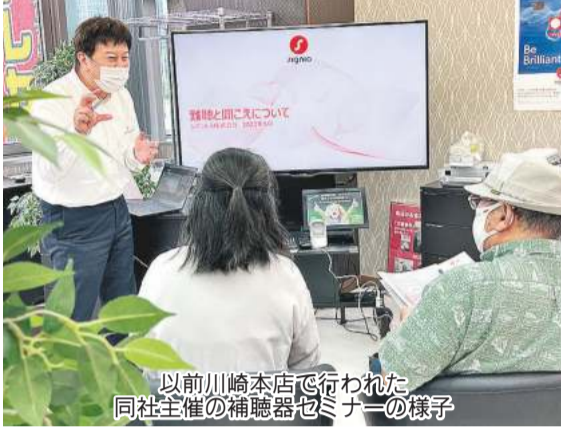
以前川崎本店で行われた同社主催の補聴器セミナーの様子

店舗はJR川崎駅東口の本店のほか、横浜市西区の横浜新都市ビル(そごう)9階に「横浜プレミアムラウンジ」も。購入時に来店が難しい場合は在宅訪問サービスも利用でき、スタッフが自宅や施設、病院な