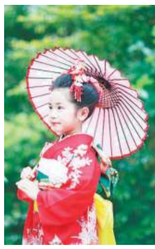
家族で思いに残る一日を

川崎日航ホテルでは、家族で思いに残るひとときを過ごしてもらおうと、12月18日(日)まで2つの「七五三プラン」を用意。どちらも予約制で七五三の子どもに千歳館のプレゼントがあります。