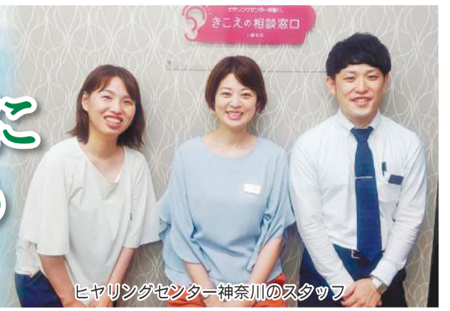
ヒヤリングセンター神奈川のスタッフ

旅行や外食などの楽しい時間は家族や友人との会話があったこそ。お出かけの前に「聞こえ」の不安を解消してもらおうと、「ヒヤリングセンター神奈川」では、川崎で「補聴器ミニセミナー」、横浜で「個別セミナー」を開催します。事前予約制。