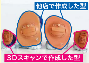
他店で作成した型 3Dスキャンで作成した型

同社では現在、以下の補聴器を薦めています。 ▽シグニア「充電式オーダーメイド耳穴型 AX」…電池交換が不要。世界初の2プロセッサ搭載補聴器で、雑音と言葉を分解する機能が大幅に向上しています ▽リサウンド「クアトロ オーダーメイド耳穴型」(左写真)…他店では大きな型しかできなかった補聴器でも、3Dスキャンすれば、より小さく作成可能。3Dスキャンを使っている店は、市内では川崎本店のみです(実施日は下記参照)