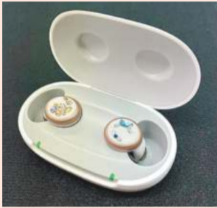
「シグニア・アクティブ」は充電式の補聴器。電池入れ替えの手間もいらず、取り扱いも簡単です

シグニア補聴器の大人気機種「シグニア・アクティブ」は、今までの補聴器のイメージを覆す、まるでワイヤレスイヤフォンのよ