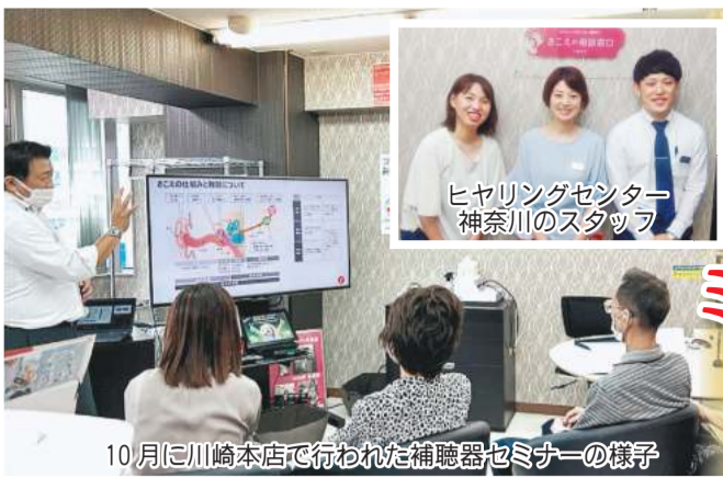
10月に川崎本店で行われた補聴器セミナーの様子