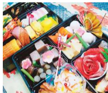
日本料理「みや川」のおせち2段重「千歳」

川崎区浜町の日本料理「みや川」では生おせち料理「千歳」(1万6200円)の予約を受け付け中。数量限定。重箱2段には華やかな料理3〜4人前がぎゅっしり。吉の重は伊達巻き、海老塩ゆで、紅白蒲鉾、黒豆、忒の重は紅白なます、スモークサーモン、