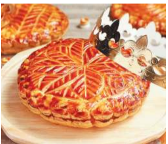
新年を祝うフランスの伝統菓子「ガレット・デ・ロワ」

川崎日航ホテルでは、新年を祝うフランスの伝統菓子「ガレット・デ・ロワ」の予約を受け付けています。「王様のお菓子」という意味のケーキの中には陶器製の人形「フェーヴ」が一つだけ隠されていて、フェーヴ入りピースを当てた人は王冠を被