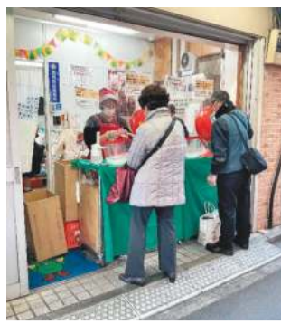
昨年の福引抽選会の様子

参加店舗で買い物や飲食をすると500円ごとに抽選補助券が1枚もらえ、4枚集めると、街内参加店舗で使える