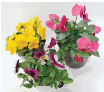
川崎区の花「ピオラ」(画像はイメージです)

買い物や食事をするに2000円で1回福引抽選会のチャンスが！特等3万円、1等1万円などの「お買