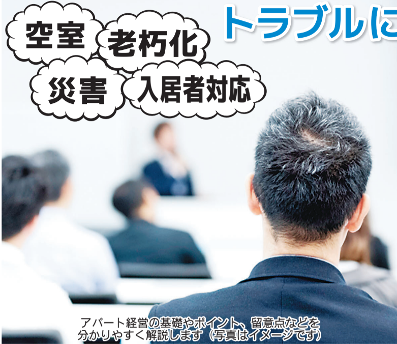
アパート経営の基礎やポイント、留意点などを 分かりやすく解説します(写真はイメージです)

旭化成ホームズでは7月8日(土)に「古くなったアパートの問題解決セミナー」を開催します。午前10時30分～正午。参加無料。会場は川崎商工会議所(JR川崎駅から徒歩約3分)。定員20人。要予約。 ■アパート経営をしている・相続する・これから始める予定がある人、必聴! 物価高や増税などに関するニュースが増える中、将来の暮らしへの備えや相続対策として「アパート経営」に注目が集まっています。 アパート経営のメリットは、家賃収入を長期間にわたって安定的に得られること。ですが、実際にアパートを経営していく中では、さまざまな悩みや疑問が生じる可能性があります。例えば、 古くなったア