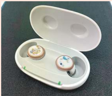
「シグニア・アクティブ」は充電式の補聴器。電池入れ替えの手間もいらず、取り扱いも簡単です

シグニア補聴器の大人気機種「シグニア・アクティブ」は、今までの補聴器のイメージを覆す、まるでワイヤレスイヤフォンのよ