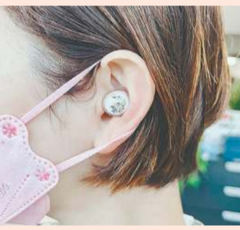
イヤフォンのような形にシグニアの音響技術を集約。鮮やかな音で聞こえをサポートします

うな、スタイリッシュなデザイン。イヤフォン型補聴器。幅広い世代から支持されています。自動で環境を認識する超広角の音響センサー搭載で、自動的に最適な音に調整。充電は充電ケース(バッテリー内蔵)にセットするだけです。ポケットサイズなので外出先でも気軽に補聴器の着け外しが可能。スマートフォンで音の調整もできます。