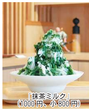
「抹茶ミルク」(1000円、小800円)

「人形工房はやし」(川崎区)の夏季限定かき氷店「けずり氷(ひ)はやし」。今年も9月中旬まで営業しています。人形が並ぶ店内に飲食スペースが設置され、8種類のかき氷が味わえます。 シロップは全て自家製。果物ベースのシロップは果汁と果肉をぜいたくに使用している。 8月31日(木)まで「TODAYを見た」で100円引き(グループ全員対象)。気軽に立ち寄っては、電話予約可。