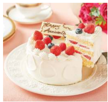
デコレーションケーキが半額に

スイーツ 3日間限定でデコレーションケーキ半額 川崎日航ホテルでは10月7日(土)~9日(月・祝)、1階ペストリーショップのオープン2周年を記念したキャンペーンを開催します。 日頃の感謝の気持ちを込めた3日間限定のスペシャルイベント。ホテルメイドのふわふわのスポンジと、北海道産生クリームが自慢のデコレーションケーキが半額に。4号・通常3500円が1750円、5号・同4800円は2400円で販売されます。 販売時間は各日とも1回目が午前11時から、2回目は午後3時から。デコレーションケーキは母のシヨート(生クリーム)4号、5号のみ。各回各種30台限定。一家族1台まで。事前予約・購入後の預かり不可。