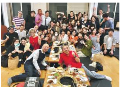
おつけもの慶の社員