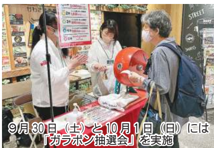
9月30日(土)と10月1日(日)には「ガラポン抽選会」を実施

お茶の専門店「茶工場 浜佐園」では、7周年特別企画福袋「777円福袋」(抹茶入り玄米茶100g、ほじり茶100g)を