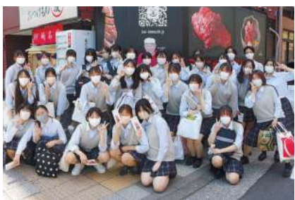
川崎市立川崎高校生活科学科の生徒さん