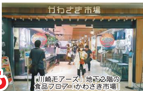
「川崎モアーズ」地下2階の食品フロア「かわさき市場」

JR川崎駅東口にある商業施設「川崎モアーズ」地下2階の食品フロア「かわさき市場(いちば)」がリフレッシュオープンから7周年! 9月30日(土)まで大感謝祭を開催しています。