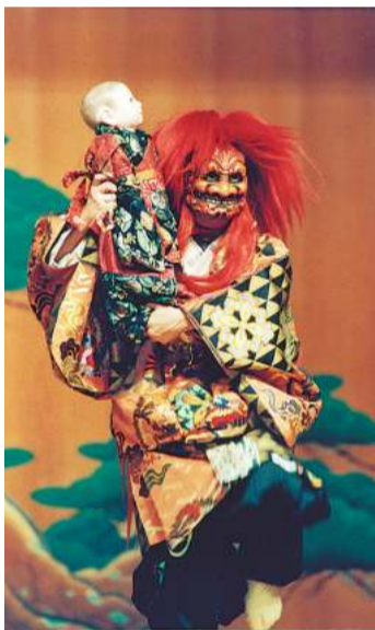
「鬼の継子」

イモノ直売所では、末広庵のまんじゅう、大原商店の菓子などの販売。川崎フロンターレによるキックターゲットもあり。もちろん、ふるん太も登場! 「縁日コーナー」では骨付きフランク、焼きそば、スープボールの販売や、スーパーム鉄砲、輪投げも。さらにスタンプリーもあり、盛りだくさんの内容です。家族みんなで楽しんでみませんか。 ※内容が変更される場合があります