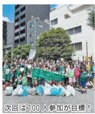
今回は100人参加が目標!

川崎駅周辺のごみを拾うボランティア活動を行う「グリーンバード川崎駅チーム」は「スターバックス コーヒー川崎地区」や川崎市と連携し、7月22日に「川崎駅クリーンアップ大作戦」を実施しました。 「店舗のある街で地域活動