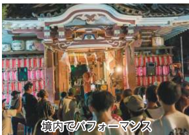
境内でパフォーマンス