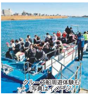
クルーズ船周遊体験も(写真はイメージ)

東海道川崎宿起立400年記念のイベント「六郷の渡しまつり2023」が10月22日(日)、六郷橋(川崎区旭町)付近の河川敷で開催されます。午前10時～午後6時。一日限りで渡し場が復活。キッチンカーなどが並ぶほか、音楽ステージも実施。クルーズ船周遊体験(予約制)では六郷橋～多摩川スカイブリッジ間を約60分かけてクルーズできます。乗船には1人1000円の乗船付き商品券の購入が必要(川崎駅周辺や当日会場などで1000円分の買い物ができます)。