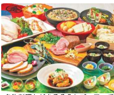
名物料理などをそろえたbuffeで香川の魅力を感じてみては

川崎日航ホテル10階・ナトウーラのランチ&ディナーbuffeで9月15日(金)～12月10日(日)、「香川うまいもんフェア」を開催します。 ランチ(平日大人4500円ほか)では、新鮮な魚を酢で締め、野菜と白みそで和えた