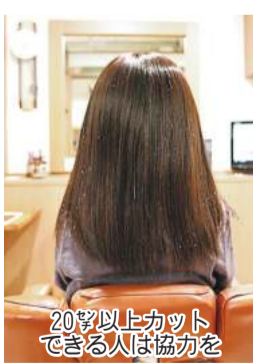
20センチ以上カットできる人は協力を

料金は、正面席3500円(全席指定)ほか。申し込みは川崎能楽堂へ電話を。 044(2)2(2)7696 川崎能楽堂 午前10時～午後5時 休水曜