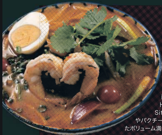
トムヤムラーメン ¥1,188

本紙掲載の記事・写真などを無断で複製・複製転載を禁じます(私的利用の場合を除く)。©中日新聞東京本社(東京新聞TODAY)2023